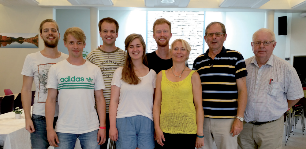
De fleste som stod for konserthelgen på Kvitsund.